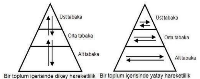
Bir toplum içerisinde dikey hareketlilik Bir toplum içerisinde yatay hareketlilik

Coğrafi hareketlilik: Bir ülkeden başka bir ülkeye veya ülke içinde bir bölgeden başka bir bölgeye yapılan göçler.